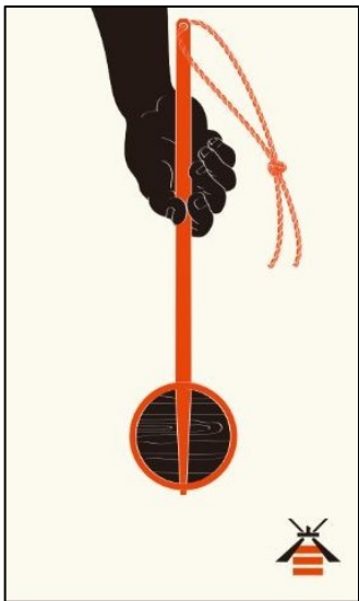
宿泊施設配布用カードデザイン